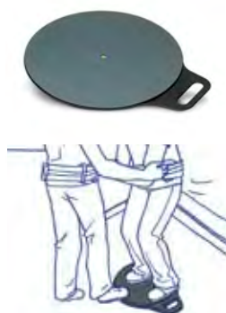
4085 5080 Turn-Table met handvat 40 cm