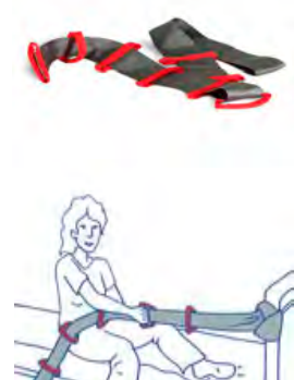
4085 6090 Flexi-Grip 8 handvaten 170 CM