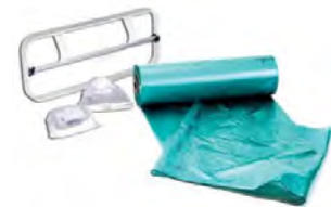
4085 9139 Glijfolie rol disposable 100mtr / 50 cm breed