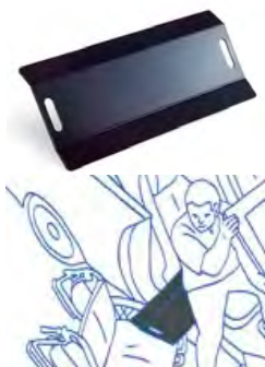
4085 5050 Easy-Glide 73x32